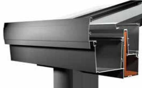
Type 4 XXL

Deze veranda is uitgevoerd met een moderne goot, passend bij een hedendaagse bouwstijl. Minimalistisch design en bijpassende staanders kenmerken dit daktype.